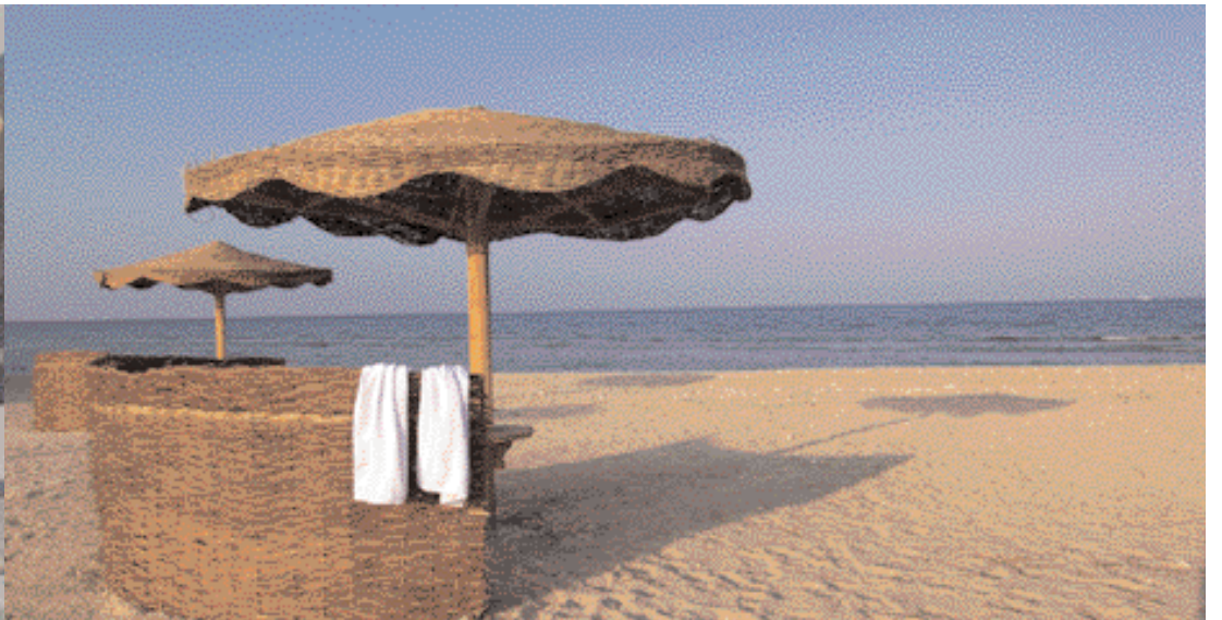
Links oben: Blick aus der Vogelperspektive auf die herrlich gelegenen 18-Loch Golfanlage „Cacades“. Erholung finden die Gäste im hoteleigenen Thallasso-Zentrum“. Wassersportler sind am riesigen Sandstrand der „Soma Bay“ goldrichtig.